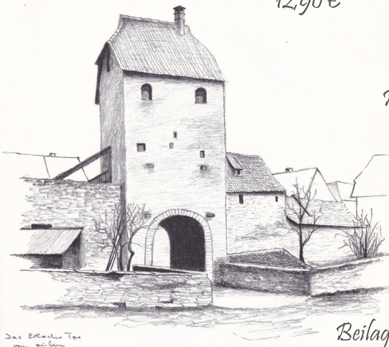
Das Erker-Tor von Aulhausen